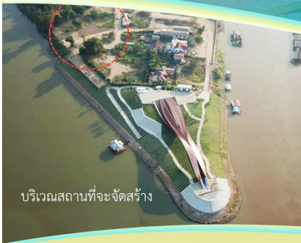
บริเวณสถานที่ที่จะจัดสร้าง

**ผู้บริจาค 10,000 บาทขึ้นไป ผ่านธนาคารกรุณาแจ้งการบริจาคที่ โทร. 081-8882455 เพื่อยืนยันข้อมูล