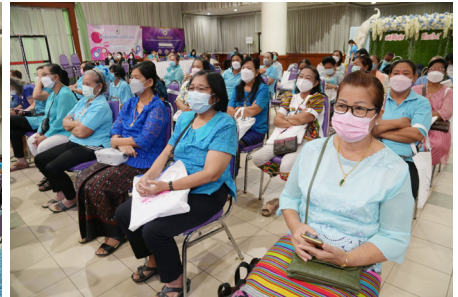
กองสวัสดิการสังคมเทศบาลนครนครสวรรค์จัด โครงการส่งเสริม อบรม ความรู้ เกี่ยวกับการพิทักษ์ความเสมอภาค และคุ้มครองสิทธิสตรี และครอบครัว ประจำปี 2565 ณ ห้องประชุมชั้น 5 เทศบาลนครนครสวรรค์