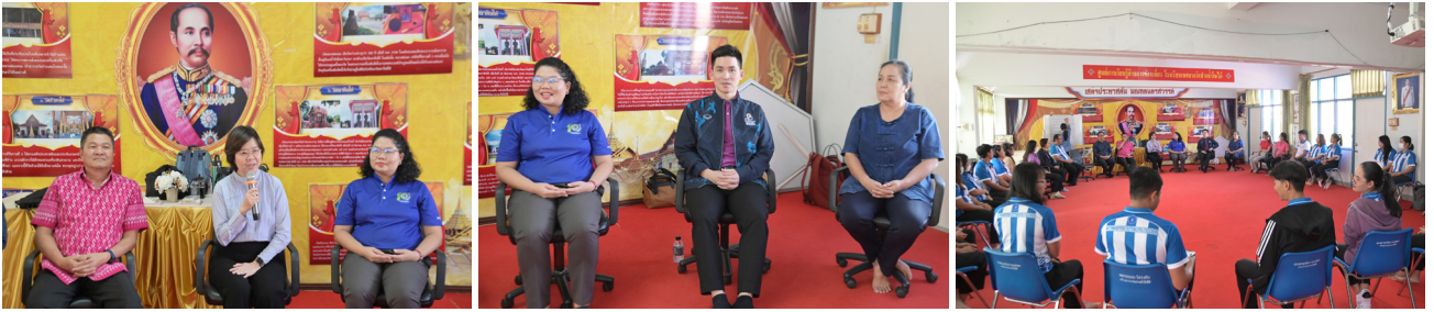
เทศบาลนครนครสวรรค์ มหาวิทยาลัยมหิดล นครสวรรค์ อบรบครูและบุคลากรสังกัดเทศบาลนครนครสวรรค์ ทำ PLC ในแนวทางจิตตปัญญาศึกษา