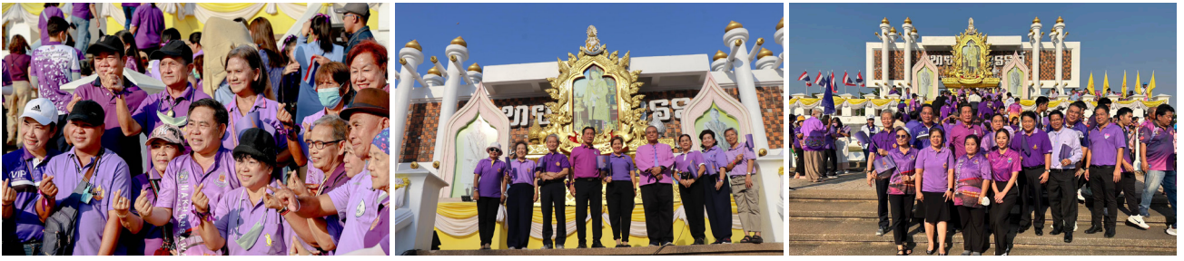
พสกนิกรชาวจังหวัดนครสวรรค์ พร้อมใจใส่เสื้อม่วง แสดงพลังถวายกำลังใจแด่สมเด็จพระกนิษฐาธิราชเจ้า กรมสมเด็จพระเทพรัตนราชสุดาฯ สยามบรมราชกุมารี